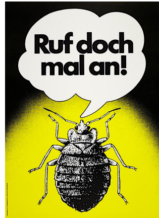
Klaus Staeck, 1977

Nach der Inbetriebnahme eines neuen Telefons, das ich genötigt war zu kaufen wegen Diebstahls meines alten Telefons, dessen Herausgabe bis heute verweigert wird, stellte ich fest, daß die Diebe nicht nur mein Eigentum widerrechtlich entwendeten, sondern auch meine Nummer manipulierten, so daß wenn ich die Nummer meines Freundes wählte, der in Essen wohnt, wurde mein Anruf an die Polizei in Berlin umgeleitet. Dreimal wählte ich gleiche Nummer, und jedesmal nahm meinen Anruf gleicher Polizeibeamte entgegen, der allerdings mir nicht erklären konnte, warum ich mit der Polizei verbunden werde, wenn ich die Nummer meines Freundes wähle. Aber ich kann