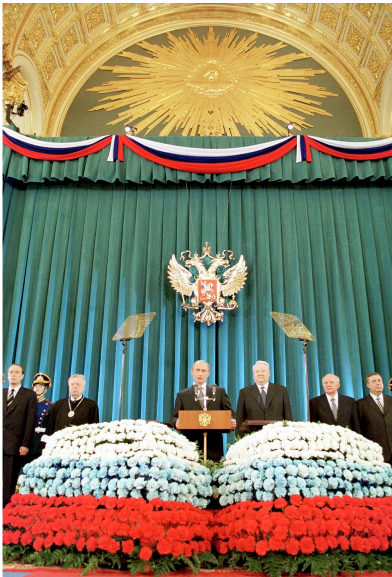
Вступление в должность Президента РФ в 2000 г.