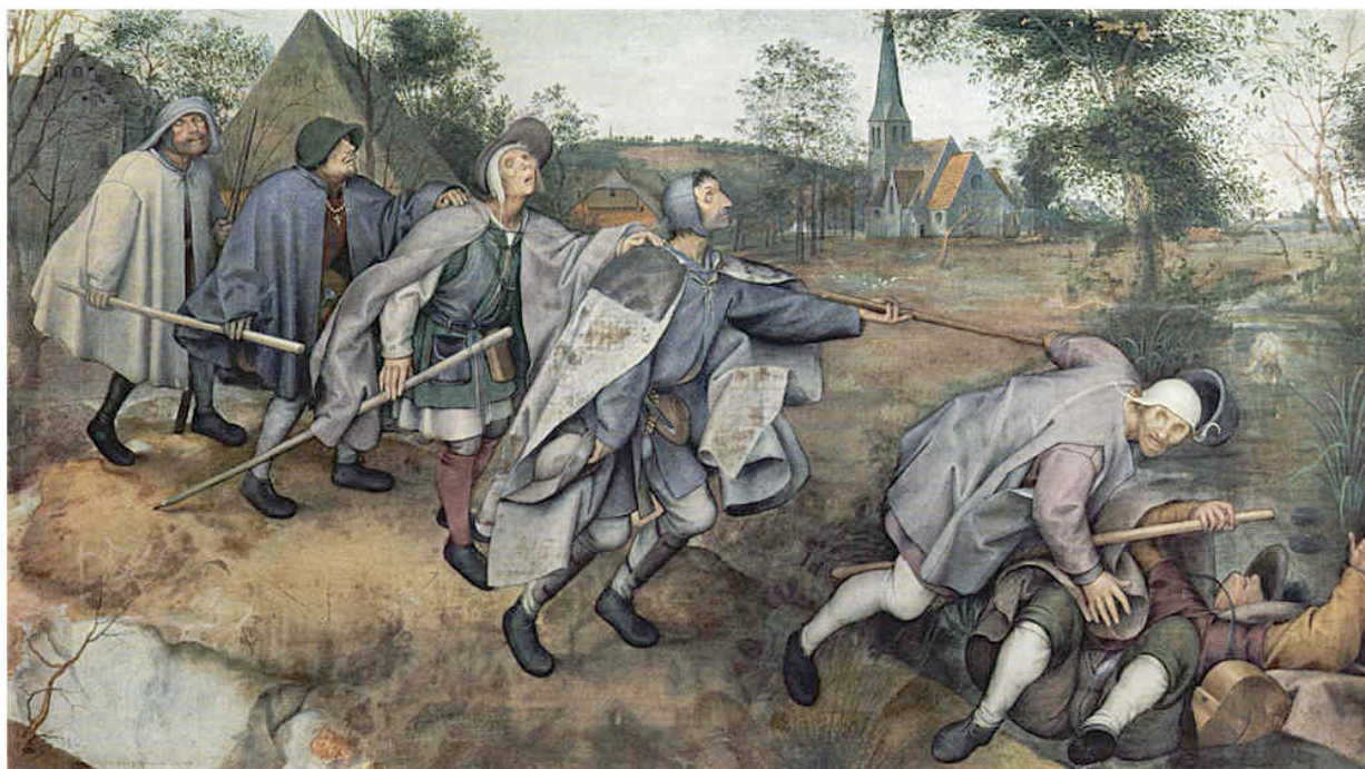
PIETER BRUEGHEL d. Ä. (1528–1569) DER STURZ DER BLINDEN, 1568.

Открытое письмо президенту и председателю правительства Российской Федерации от 9 сентября 2009 года.